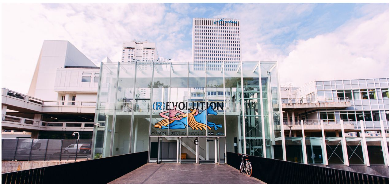
Museumpark-ingang, (R)EVOLUTION tentoonstelling 2021.

Beide onderwerpen worden geïntegreerd in het programma voor 2022.